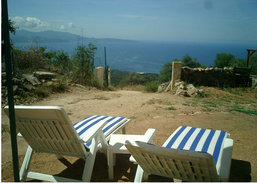
Terrasse plein sud sur le Golfe de Sagone