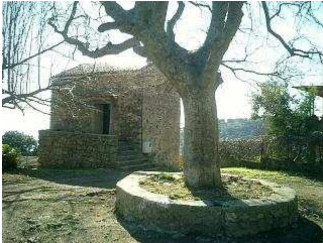
Place du Hameau de Rundolino