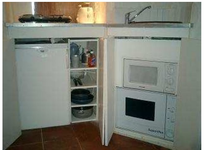
le coin cuisine dans le séjour