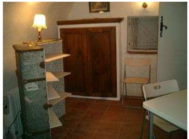
Les rangements de la chambre