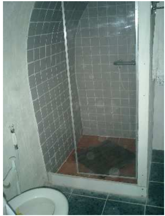
Salle de douche avec machine à laver le linge et congélateur sèche cheveux et fer à repasser