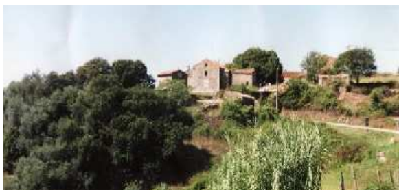
Le hameau de Rundolino