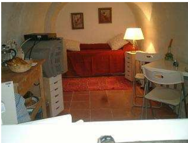
Séjour avec une partie du coin cuisine