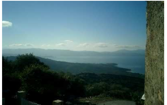
Vue de l'appartement